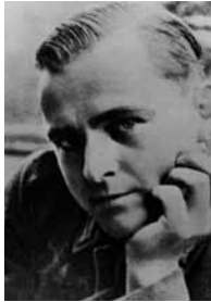
Willi Graf 1918 - 1943